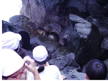
ポットホール(写真中央の丸い石)見学