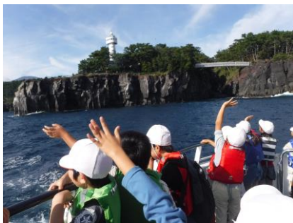
遊覧船から城ヶ崎海岸吊り橋と灯台を見る