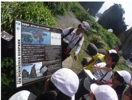
浮島海岸でのジオガイドの説明