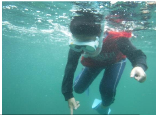
スノーケリングの様子(購入したカメラで撮影)