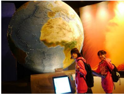
エントランスより各自で調べ学習開始