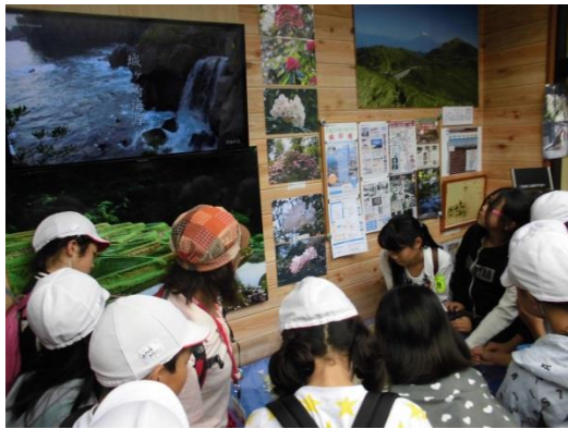
ジオパーク天城ビジターセンターでの説明