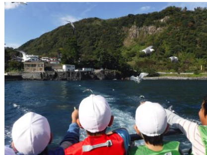
遊覧船に近づいてくる海鳥