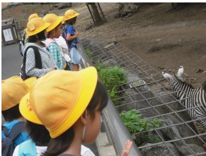
園内の動物たちを見学