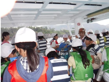
遊覧船から城ヶ崎海岸の地形を観察