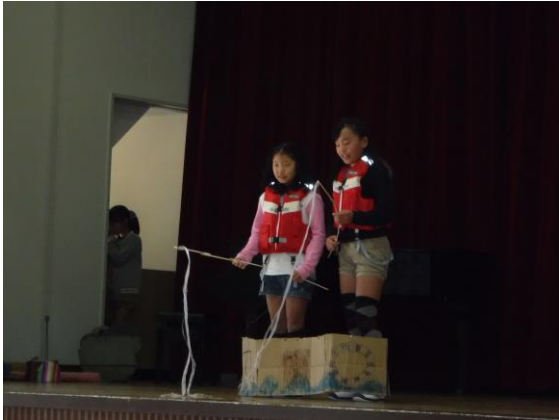
新聞や日記のような形で学習のまとめを掲示