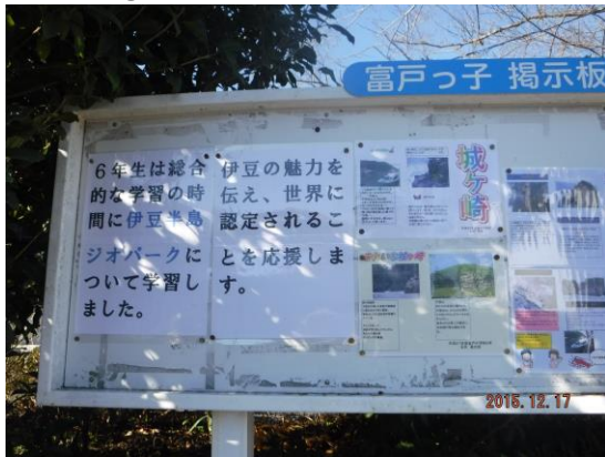
富戸っ子掲示板に貼られたリーフレット