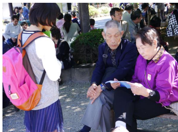
個々に作成したジオパークを宣伝するリーフレットを浅草・上野等で配布する6年生