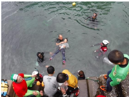
富戸港での着衣泳