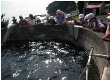
静岡県水産技術研究所 伊豆分場にて、 養殖漁業等についての説明を受ける