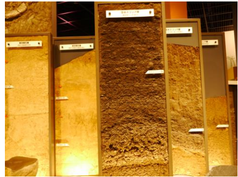
様々な地層があるコーナーで大地の学習