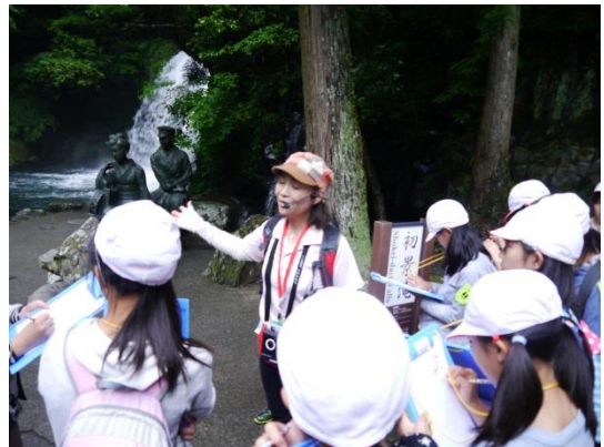
河津七滝でのジオガイドの説明