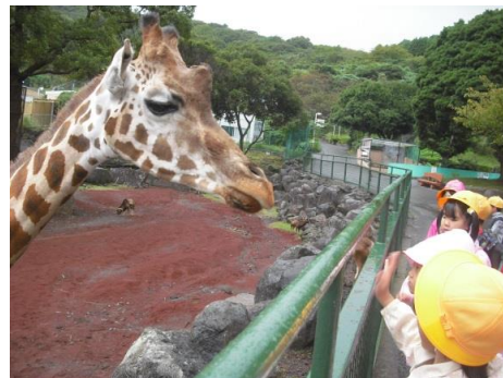
きりんにあさをあげる様子