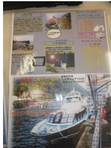
リーフレットの作品の一例