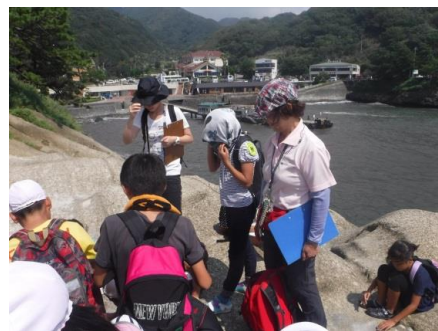
堂ヶ島海岸でのジオガイドの説明